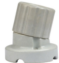
PORCELANA E27 INCLINADO DESMONTÁVEL BPA 27023