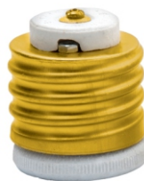
ADAPTADOR DE PORCELANA PARA BOCAL E40 x E17 COMPACTO BRANCO APA 40274