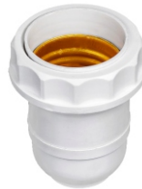
TERMOPLÁSTICO E27 ABAJUR BRANCO BTA 27023