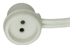
BASE PARA LÂMPADA FLUOR TUBULAR T5 2 A 250 V BLA 14312