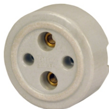
TOMADA EXTERNA DE PORCELANA 2 POLOS