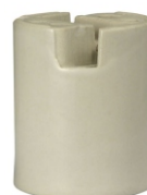
PORCELANA E40 BPA 40063