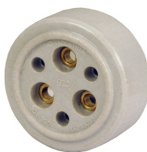
TOMADA EXTERNA DE PORCELANA 3 POLOS