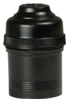
TERMOPLÁSTICO E27 PENDENTE SEM CHAVE PRETO BTA 27093