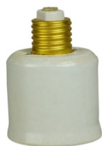
ADAPTADOR DE PORCELANA PARA BOCAL E27 x E40 BRANCO APA 27403