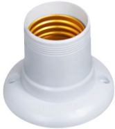
TERMOPLÁSTICO E27 FIXO DE TETO BRANCO BTA 27033