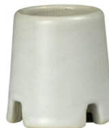
PORCELANA E27 REFORÇADO BPA 27093