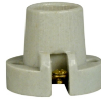
PORCELANA E14 FIXO DE TETO BPA 14033