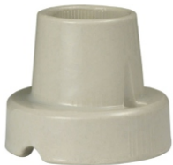
PORCELANA E27 FIXO DE TETO BPA 27033