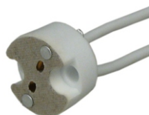
BASE PARA LÂMPADA DICRÓICA G 5,3 BLA 12112