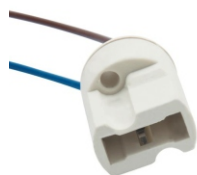
BASE PARA LÂMPADA HALOPIN COM RABICHO BLA 15112