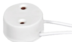
BASE PARA LÂMPADA FLUOR TUBULAR 2 A 250 V CEBOLINHA BLA 14112