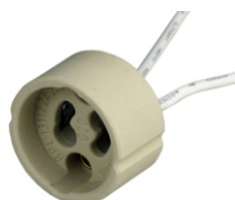
BASE PARA LÂMPADA DICRÓICA GZ 10 / GU 10 BLA 13112