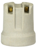
PORCELANA E27 PARA SPOT COM ALÇA BPA 27123