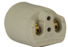
PORCELANA E27 PARA SPOT BPA 27113