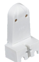
BASE PARA LÂMPADA FLUOR TUBULAR 2 A 600 V ANTI VIBRATÓRIO BLA 14212