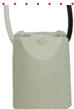
PORCELANA E27 PARA SPOT DUPLO CHANFRADO COM RABICHO BPA 27134