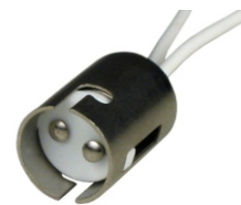
BASE PARA LÂMPADA AR 70 BLA 11112