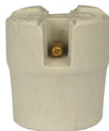
PORCELANA E27 PARA PLAFONIER BPA 27063