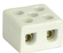
CONECTOR DE PORCELANA 6 mm 2 POLOS CPA 10623 CONECTOR DE PORCELANA 10 mm 2 POLOS CPA 11023 CONECTOR DE PORCELANA 16 mm 2 POLOS CPA 11623