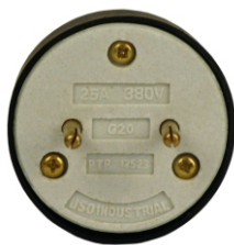
PLUG PARA TOMADA DE PORCELANA 2 POLOS