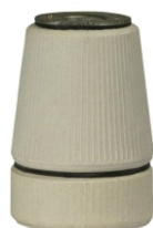
PORCELANA E27 DE TEMPO BPA 27153