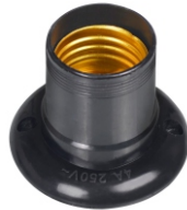
TERMOPLÁSTICO E27 FIXO DE TETO PRETO BTA 27036