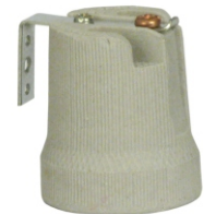
PORCELANA E27 PARA SPOT COM ALÇA COM SUPORTE BPA 27125