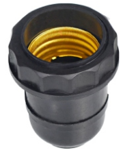
TERMOPLÁSTICO E27 ABAJUR PRETO BTA 27026