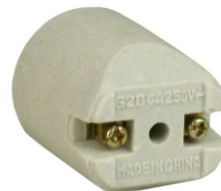
PORCELANA E27 PARA SPOT DUPLO CHANFRADO BPA 27133