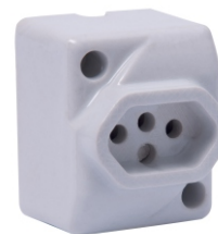
TOMADA EXTERNA DE PORCELANA 25 A 2 POLOS + T PLUG ABNT TEA 22523