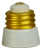
ADAPTADOR DE PORCELANA PARA BOCAL E40 x E27 BRANCO APA 40273